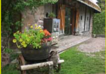
Der Plattner Bienenhof Il museo di apicoltura