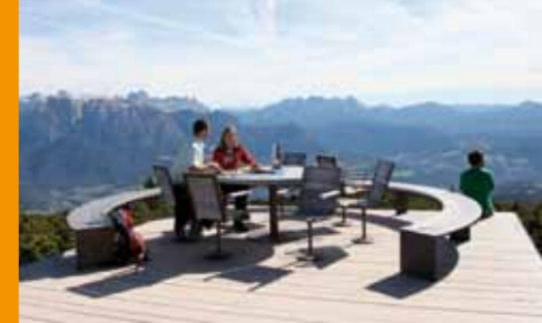
Rittner Horn Corno del Renon

Das Sonnenplateau Ritten ist ein beliebter Ferienberg und Kraftplatz um körperliche und geistige Vitalität zu finden. Viel Natur, ein faszinierendes Panorama auf die Dolomiten und eine einzigartige Erreichbarkeit von und in die Landeshauptstadt Bozen machen dies möglich.