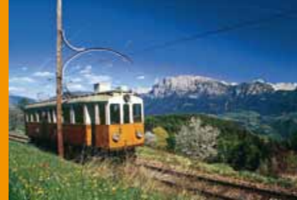
Rittner Bahn Treno del Renon