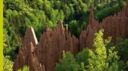
Rittner Erdpyramiden Piramidi di terra