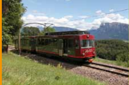
Neue Rittner Bahn Nuovo treno del Renon