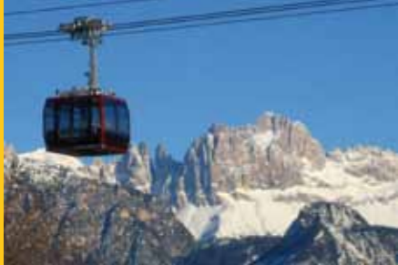
Rittner Seilbahn Funivia del Renon